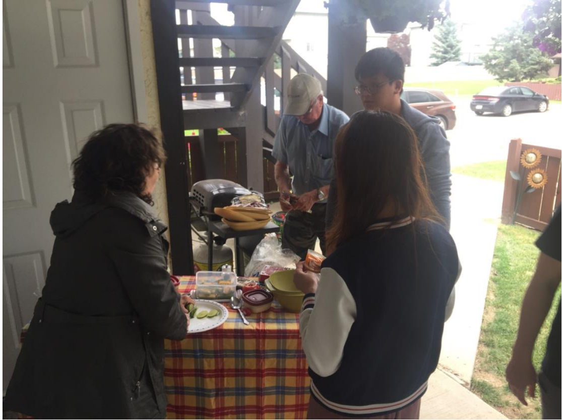
與房東 BBQ 聚餐