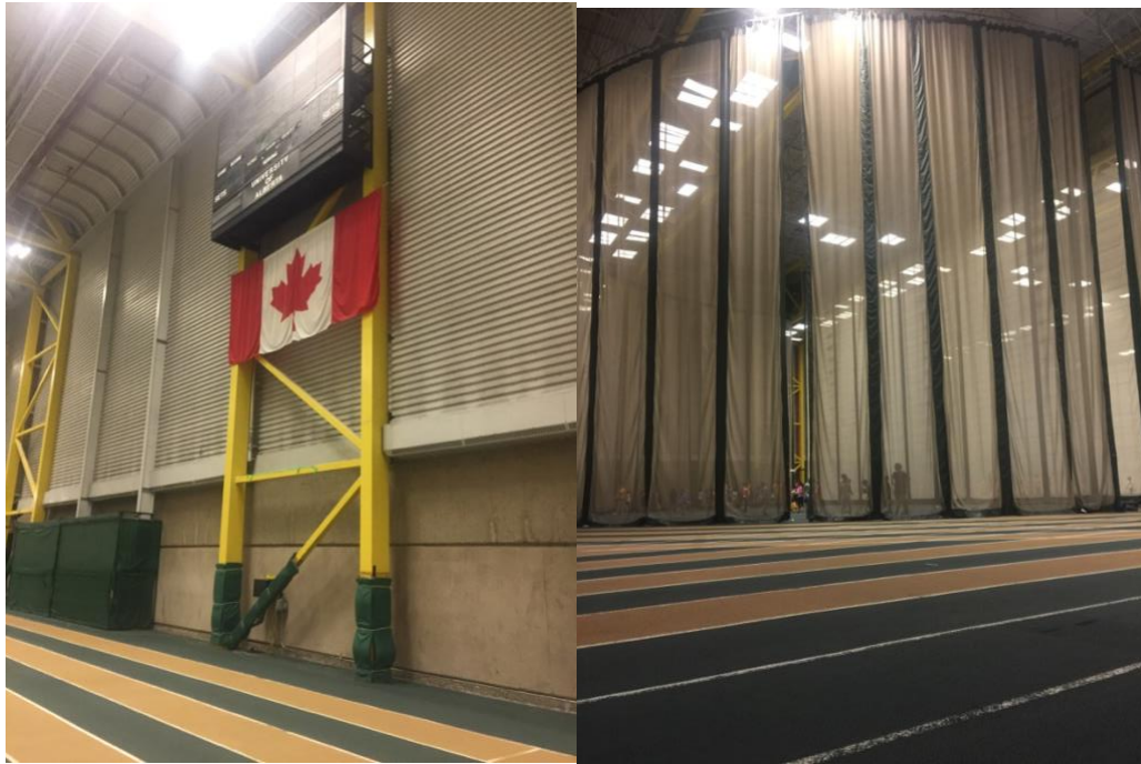
為應付最低-40 度 C 而建立的室內體育館