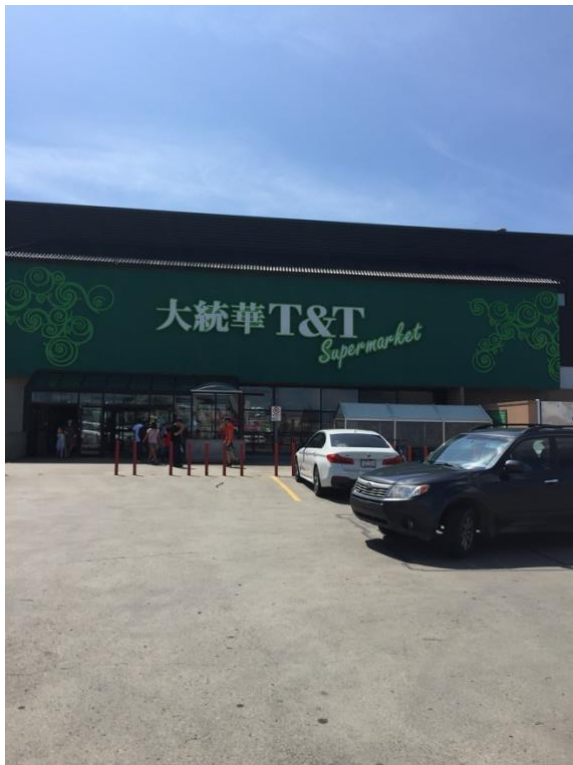
華人超市 大統華 T&T