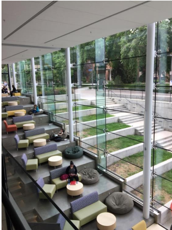
學校到處都有的自習座位